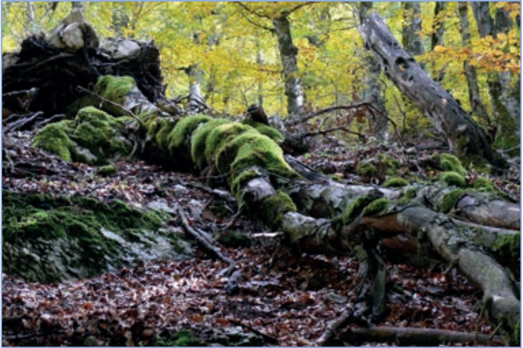
figura 9a Un grosso faggio schiantato a terra