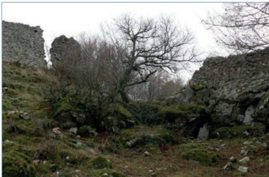
figura 13 I ruderi dell'insediamento di Mirandella, considerato l'antico abitato di Varco

oggi l'agricoltura è del tutto marginale (Figura 14), restando finalizzata all'autoconsumo.