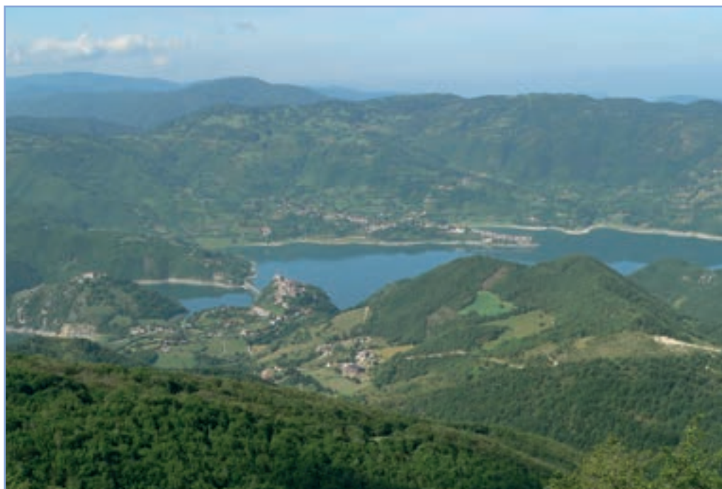
figura 20b Il lago artificiale del Turano - ben visibili al centro i paesi di Castel di Tora e Colle di Tora - FOTO DI A. PIERONI