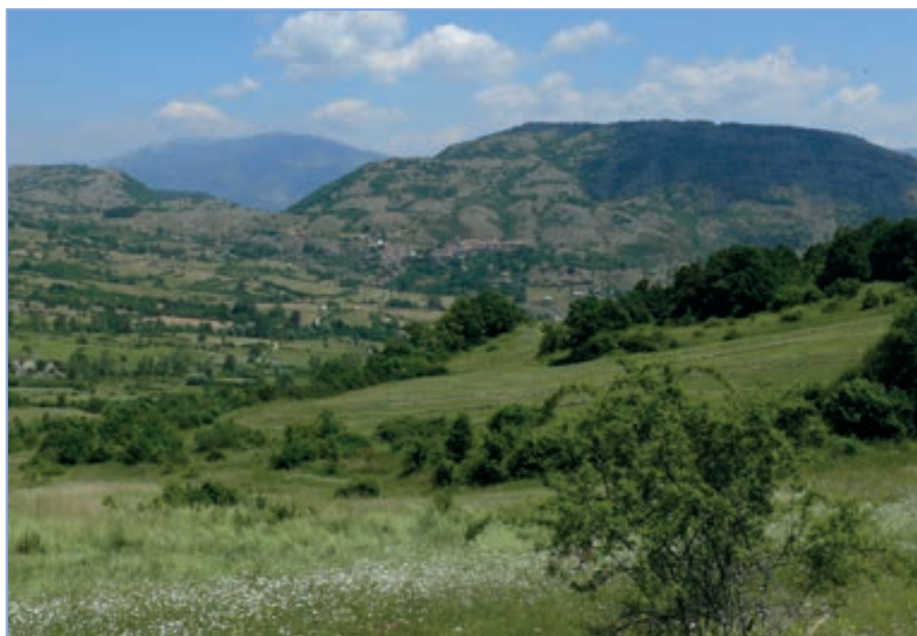
figura 14 Paesaggio agrario presso La Forca di Vallecupola