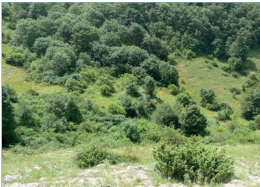
figura 19 Un bosco di nuova formazione in contatto con un pascolo cespugliato

(turnazione) non consente lo sviluppo di alberi di taglia idonea all'occupazione da parte di questi animali: gli alberi lasciati a dimora hanno un'età pari a quella della turnazione (per il cerro 16 anni, per il faggio 25 anni) o tutt'al più di età doppia (matricine), si tratta in ogni caso, di alberi di dimensioni modeste.