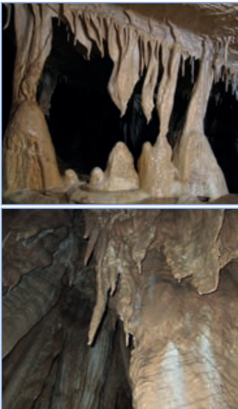
figura 26b/c Concrezioni all'interno di una grotta

Nella Riserva alcune formazioni vegetali costituiscono degli habitat d'importanza comunitaria (secondo la Direttiva Habitat) e come tali soggetti a particolare protezione. Due di questi habitat, in virtù di una distribuzione importante in ambito europeo e per la loro rarefazione, sono considerati di prioritaria importanza: sono le faggete che ricoprono i versanti nord orientali dei due principali massicci montuosi della Riserva, per le quali sono riconoscibili i caratteri dei "faggeti degli Appennini con Taxus e Ilex " e le praterie sommitali dei monti Cervia e Navegna, che grazie alle fioriture