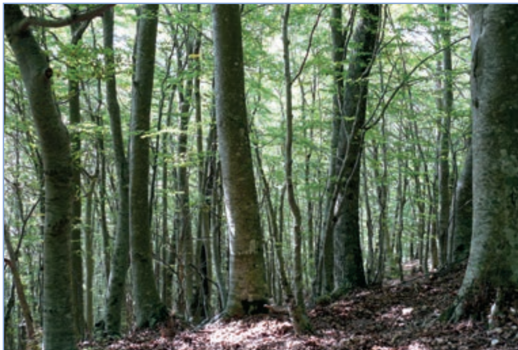
figura 17 Aspetto di un bosco d'alto fusto