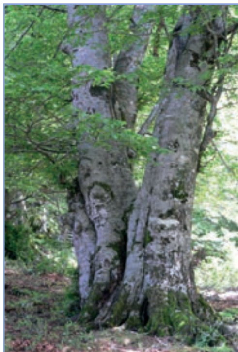
figura 30 Faggi di notevole dimensione in località Feuciari - Monte Navegna

varietà di cavità può aumentare potenzialmente la ricchezza in specie.