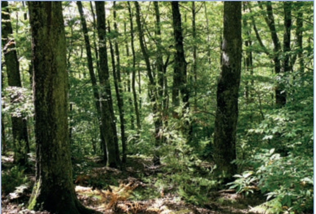
figura 27b Bosco misto a prevalenza di cerro (Quercus cerris)