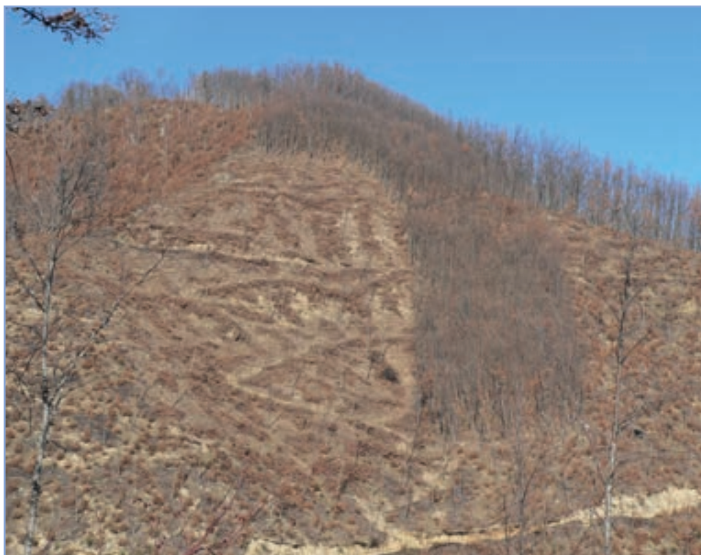
figura 8 Un bosco sottoposto a periodico taglio (governo a ceduo) - si noti la diversa epoca dei tagli, al centro la tagliata recente con rilascio di alcune matricine

I boschi del nostro Paese sono troppo spesso gestiti in modo intensivo (Figura 8) e anche i grandi alberi non sfuggono al taglio, per non parlare delle piante morte o deperenti. Abbiamo invece bisogno di conservare grandi alberi, legno morto (Figura 9), aree forestali non gestite: per evitare di perdere tutte le meravigliose forme di vita animale che dipendono dai boschi maturi.