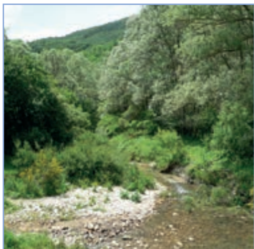
figura 29a Vegetazione ripariale presso il fosso di Riancoli