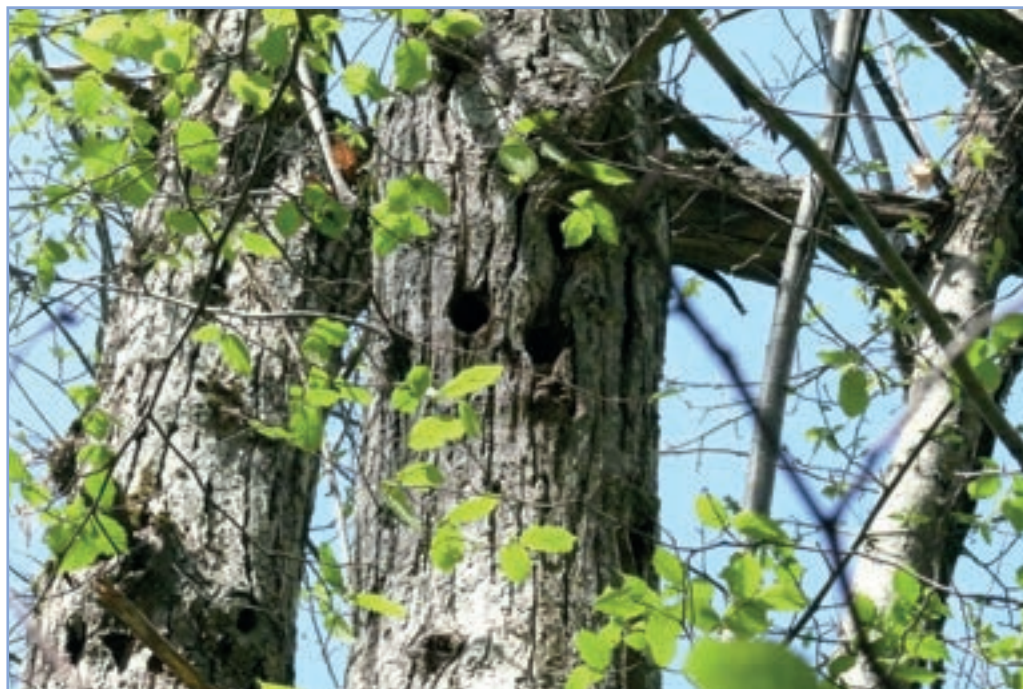
figura 16b Fori di picchio