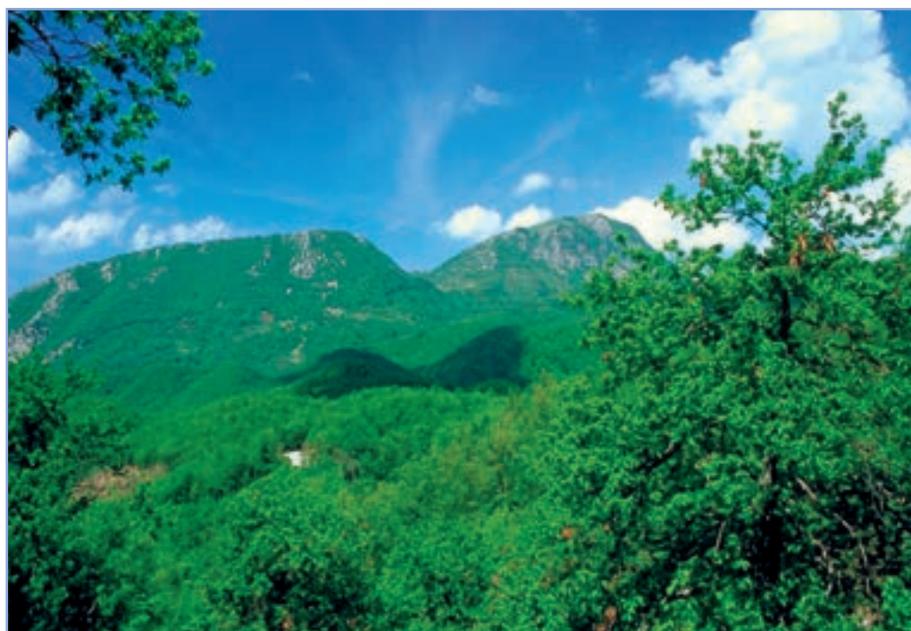
figura 15 Boschi a perdita d'occhio sullo sfondo dei monti Cervia e Navegna