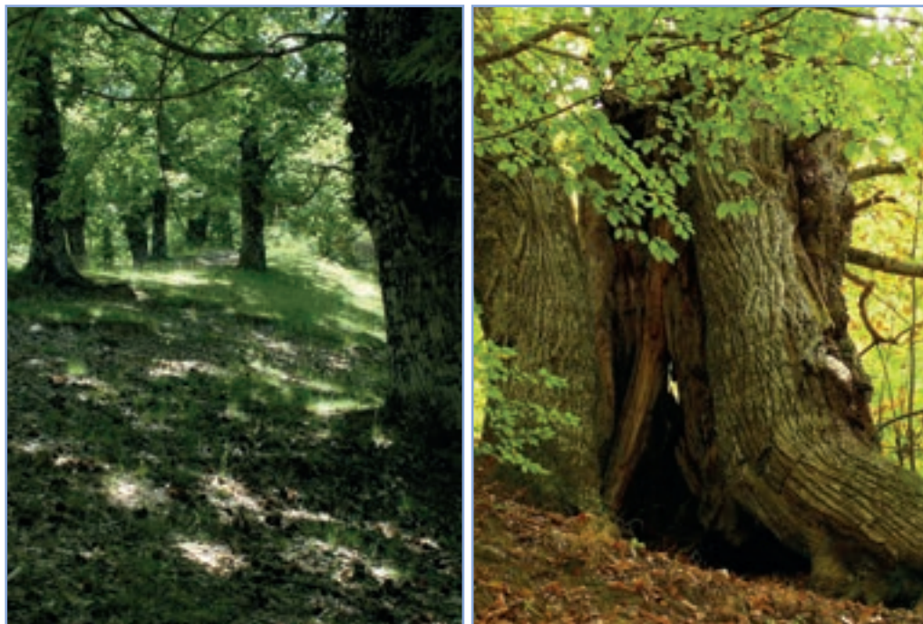
figura 11 I castagneti da frutto della Riserva Naturale includono esemplari di notevole dimensione