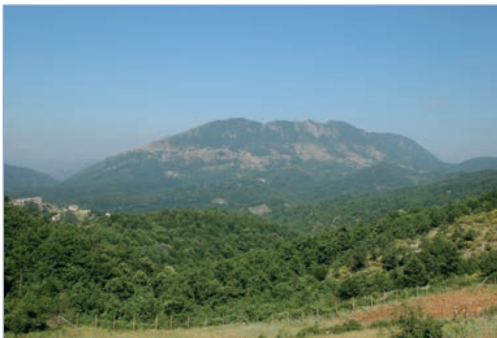
figura 22 Il Monte Cervia - versante orientale