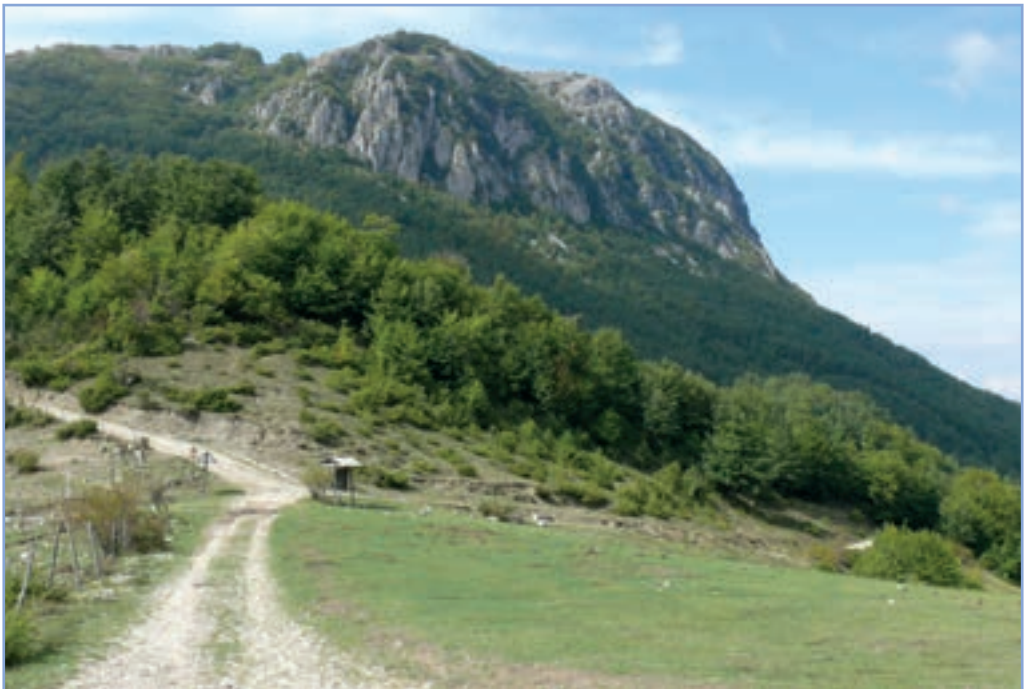
figura 21 Il Monte Navegna, vista sul versante sud orientale