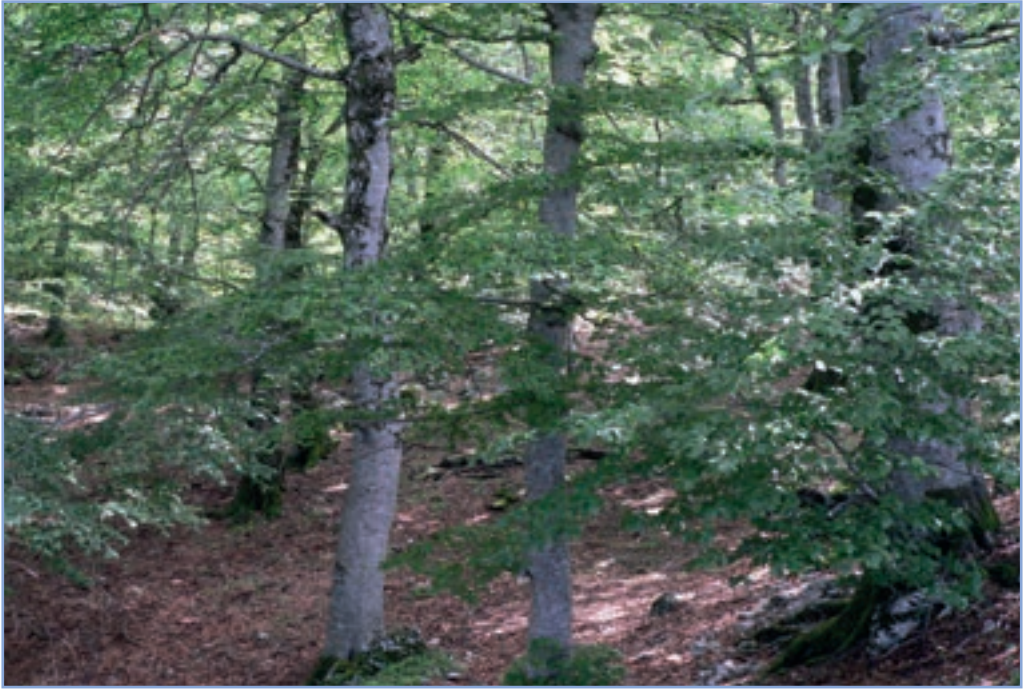
figura 27a Boschi di faggio (Fagus sylvatica)