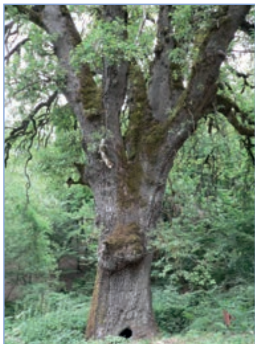
figura 16a Una roverella ( Quercus pubescens ) pluriscolare nei pressi della località di Cerreto a Marcellini