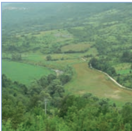
figura 29b Vegetazione ripariale discontinua lungo il fiume Turano

ricerca) sono gli ambienti forestali, gli ambienti di transizione tra le aree boscate e i prati pascoli (ecotoni), gli ambienti acquatici, gli ambienti antropizzati (ad es. i centri storici e le aree con ruderi) e quelli ipogei.