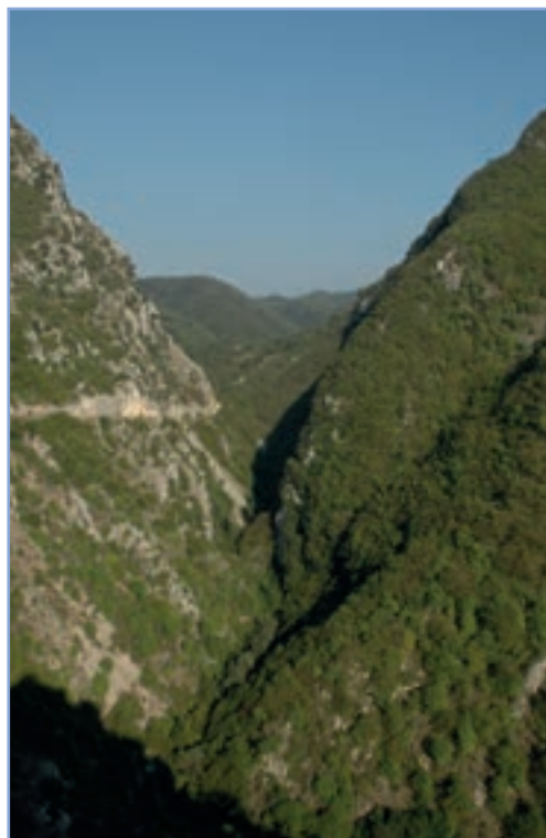
figura 25 Le gole dell'Obito