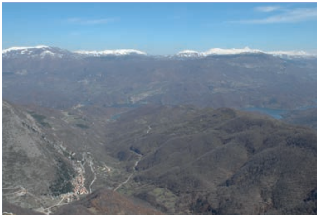
figura 20a Il bacino artificiale del Salto, sullo sfondo i monti del Cicolano e le vette innevate abruzzesi