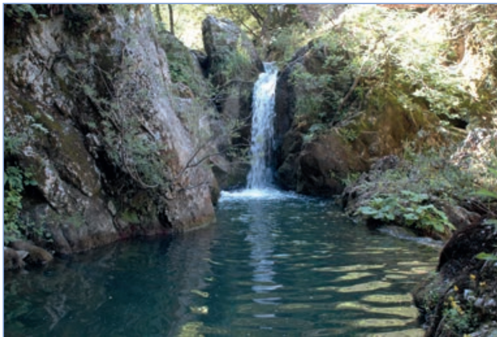
figura 24 Un torrente all'interno della Riserva

Il settore collinare a ridosso della dorsale montuosa, presenta nella sua parte orientale rocce costituite da un'alternanza di arenarie e marne, nota con il termine di "flysch" e risalenti al Miocene superiore (13 - 6 milioni di anni fa). Mentre il settore collinare occidentale, a ridosso del fiume Turano, è invece caratterizzato da litologie a composizione variabile quali breccie, conglomerati, ghiaie e sabbie, di origine plio-pleistocenica (5 - 1,6 milioni di anni fa).