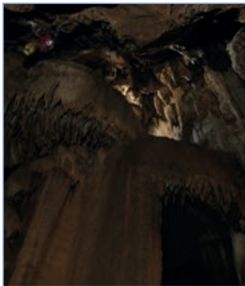
figura 26a Speleologi all'interno di un ampio sistema ipogeo nel Comune di Nespole

Nell'area protetta (data la natura carbonatica delle litologie) si trovano anche forme di carsismo ipogeo come pozzi carsici e grotte (Figura 26).