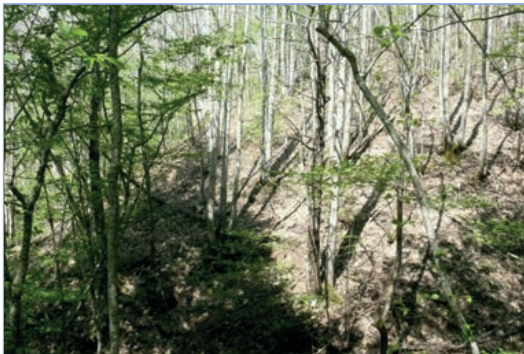
figura 18 Aspetto di un bosco ceduo sfruttato per la produzione di legna