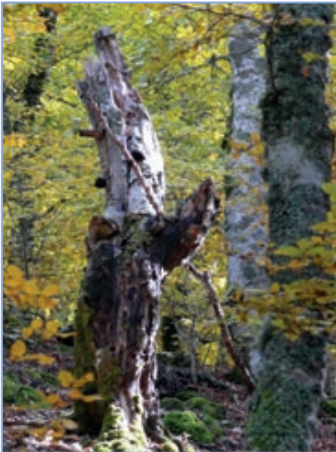
figura 9b Un albero morto in piedi all'interno di una faggeta - entrambi costituiscono l'habitat per parecchie specie animali

I pesticidi, in agricoltura e in generale le pratiche agricole intensive, stanno avvelenando gli animali insettivori e stravolgendo gli equilibri naturali delle nostre campagne. Fiumi, laghi e stagni a volte appaiono irrimediabilmente degradati: le loro acque sono inquinate e la vegetazione riparia distrutta o alterata. Questi ambienti sono importanti perché proprio lì molte specie di chiroterri vanno a caccia d'insetti.