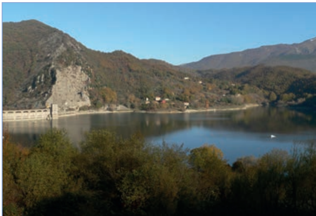
figura 12 La diga presso il Lago del Salto