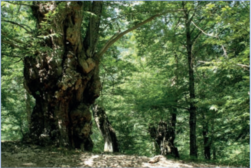
figura 28 Castagneti da frutto con esemplari monumentali

di diverse specie di orchidee, costituiscono l'habitat delle "formazioni erbose secche seminaturali e facies coperte da cespugli su substrato calcareo". Altri habitat d'importanza comunitaria, sono localizzati nella vegetazione che accompagna le sponde di alcuni corsi d'acqua, costituita da salici comuni e pioppi bianchi: "foreste a galleria di Salix alba e Populus alba ", e nella vegetazione rupestre (queste piante pioniere, dette anche casmofite, si adattano a crescere nelle fessure della roccia) che si sviluppa presso alcune pareti rocciose che si affacciano nella gola dell'Obito e nei settori orientali del Cervia: "versanti calcarei alpini e submediterranei".