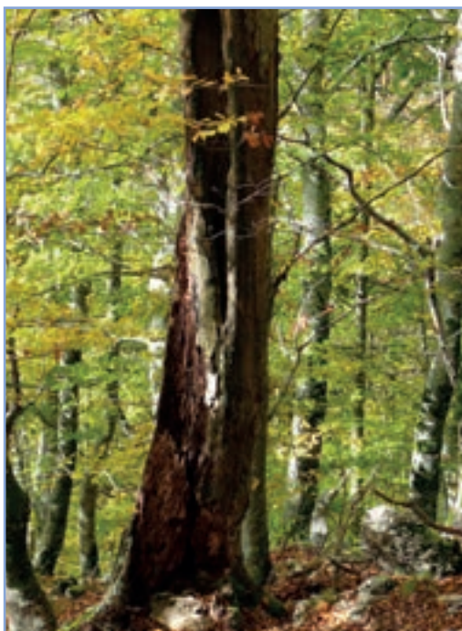
figura 16c Un albero marcescente all'interno di una fustaia - FOTO DI A. PIERONI