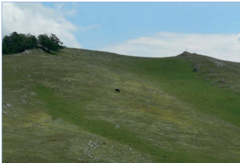
figura 10 Prateria sulla sommità del Monte Navegna

Il territorio della riserva ricade in un'area da sempre considerata di confine: in epoca arcaica tra le popolazioni Sabine e quelle degli Equi, successivamente tra lo Stato Pontificio e il Regno delle Due Sicilie. Fonti storiche testimoniano di insediamenti umani fin dall'antichità, ma è soprattutto nel periodo medievale che fiorirono gli insediamenti in tutto il territorio (Figura 13). Oggi quest'area soffre (come gran parte delle zone appenniniche) di un forte spopolamento che ha portato, a partire dagli anni '70, ad un deciso declino della popolazione residente con un invecchiamento progressivo della stessa. Le attività agro silvo pastorali, limitate alle zone pedemontane e collinari, sono andate conseguentemente diminuendo, tanto che