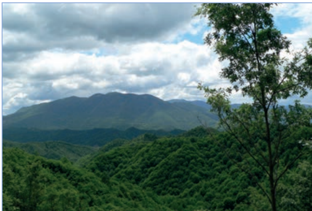
figura 23 Boschi misti presso il paese di Nespole - sullo sfondo i rilievi montuosi dell'Abruzzo - FOTO DI A. PIERONI